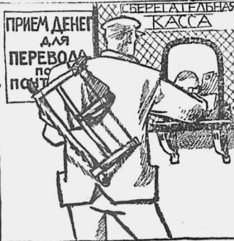
На сезонную работу Отправляются каждый год Из одной деревни братья Пантелеймон и Федот.