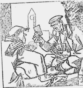
Наш Федот—бедовый парень До картишек он охоч, То, что днем он заработал, Пройграть умеет в ночь.