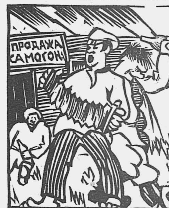
зато работают самогонщики, хулиганы.