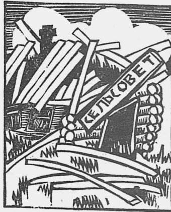
В Явинском не работает сельсовет.

И ткнул в грудь председателя раз, другой. Вытолкнутый на улицу продолжал лепиться к