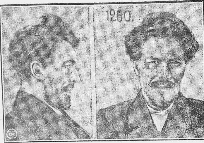
Фотография А. И. Рыкова в 1912 году, сделанная департаментом полиции. Найдено в Ленинградском Губернском Архиве.