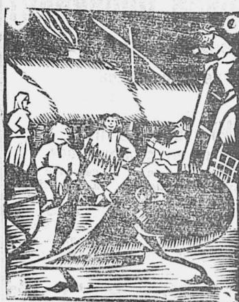
Не ездите на сохе, а ездите на хороших плугах.