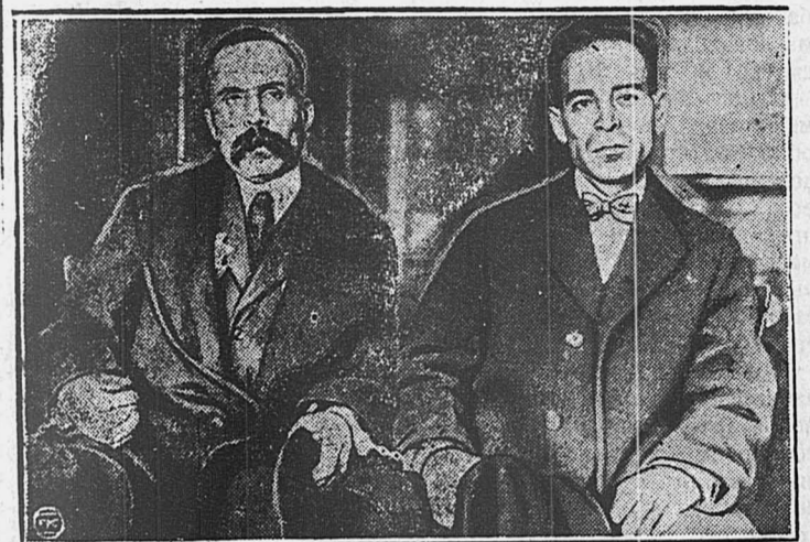
«Человеческий язык не в состоянии передать того, чьими испытали за эти семь лет,—заявили присужденные к смертной казни коммунисты Сакко и Ванцетти.

ПАРИЖ, 3. Палата постановила отсрочить заключение коммуниста Кашена в тюрьму до