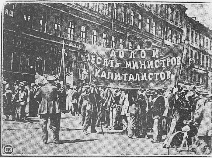
Июльские демонстрации, 3-5 июля 1917 г.