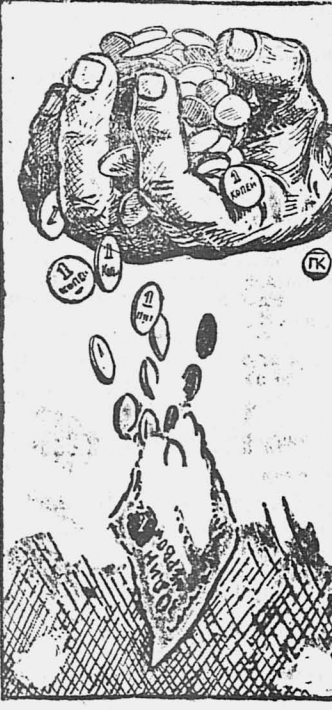
Не место тем в советском учреждении, у которых сквозь пальцы сыплется деньги.

ломаются телеги, рвутся хомуты, а вместе с этим сыплется матерщина. — Свою-бы построить надь. Да как е тут... Кредитка откачивается, у самих сил нету,— рассуждают крестьяне. Часто мы толкуем о режиме экономии. По целым часам слова, как в ступе воду толчем, а это вот под носом не видим. Я предлагаю, организовать кустарно-промысловую артель, которая и постройт мельницу. Боровской.