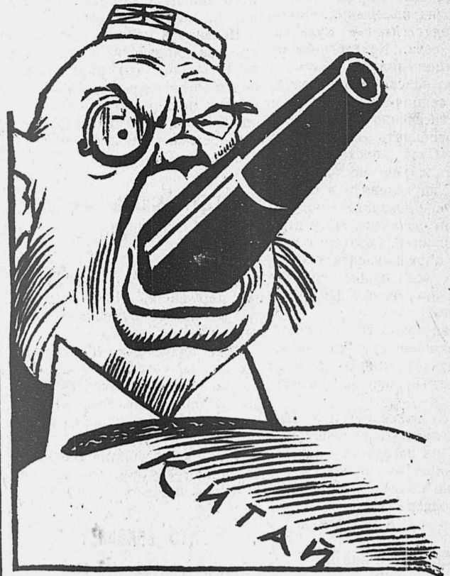
Язык империалистов в Китае.