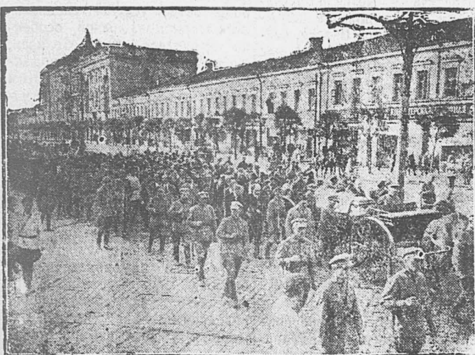
Траурная процессия на Тверской улице.