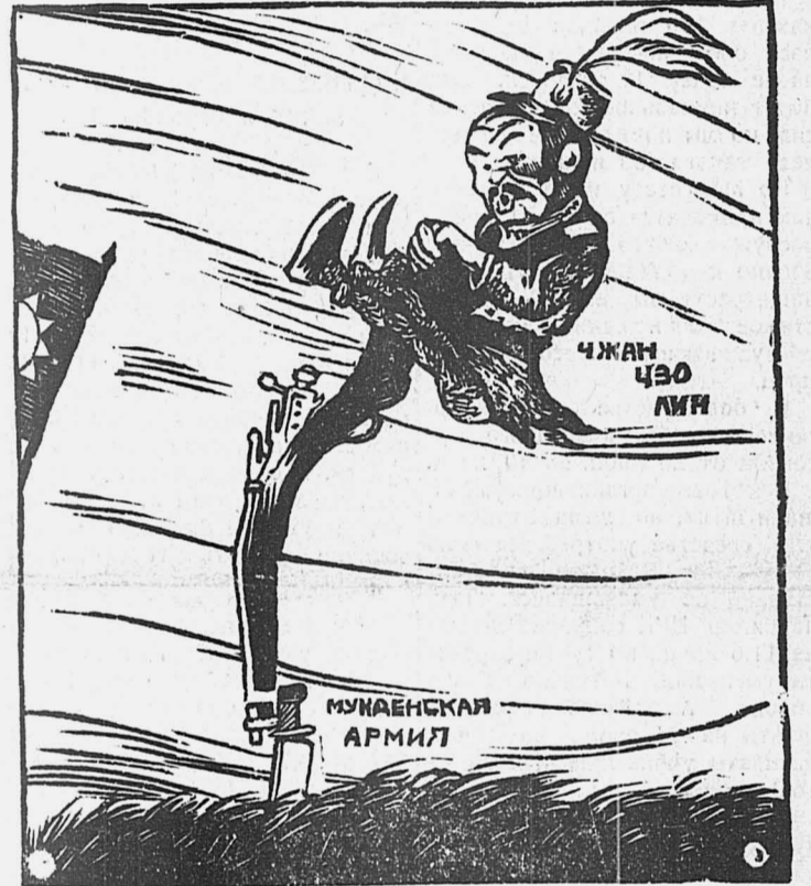
Чжан-Цзо-Лин.—Ой, ой! Сильно дует с Хенани.