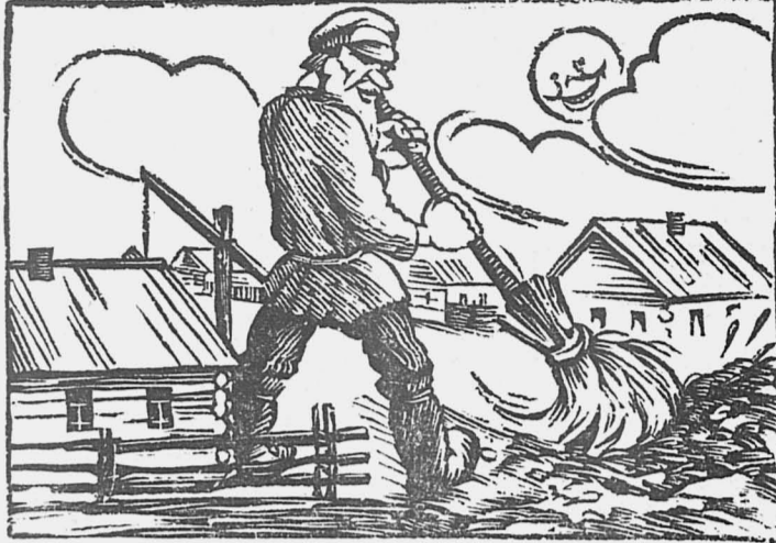
— Крестьянин! Выметай из вашей деревни растратчиков. Они вам мешают вести борьбу за лучшее крестьянское хозяйство.