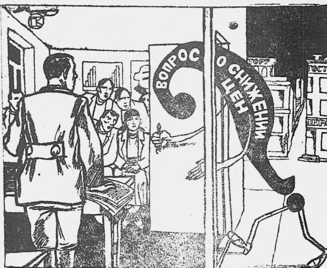
Такой вопрос должен задать крестьянин в своей потребилке, прежде чем купить какой-нибудь товар.