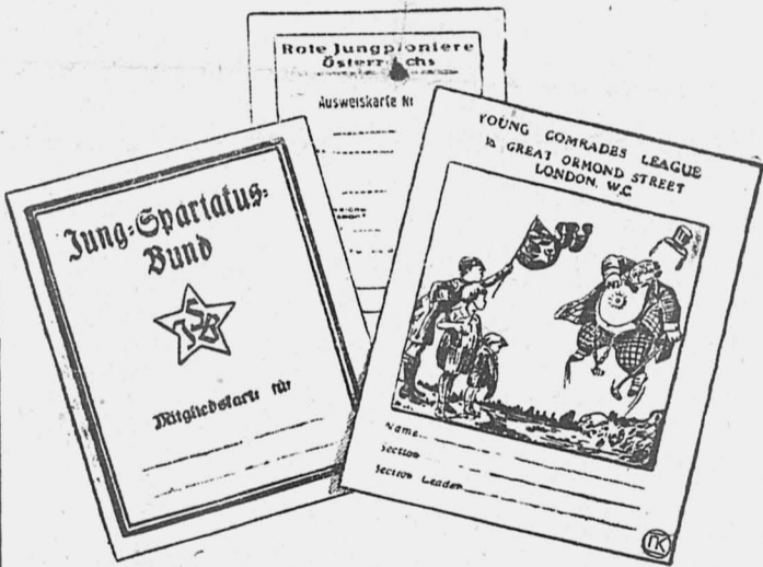
«Пионерские партбилеты» за границей. Слева германский, по середине австрийский, справа английский.