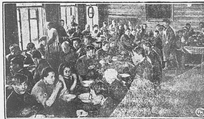
На снимке: члены коммуны в общей столовой за обедом.

Близ Москвы, на станции Болшево, с 1924 года существует трудовая коммуна ОГПУ, организованная по идее покойного тов. Держжинского.