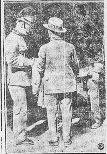
На снимке—полиция допрашивает и обыскивает входящих и выходящих из здания торгпредства.