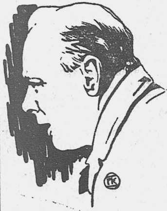
Твердолобый из твердолобых. Черчилль.

Твердолобые продолжают кампанию за разрыв англо-советских отношений.