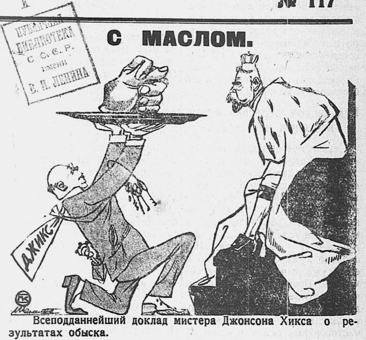
Всеподданнейший доклад мистера Джонсона Хикса о результатах обыска.

66578 голосов аннулировано. Почти все аннулированные голоса поданы за список левицы. Наибольшее число мандатов получили правые 47, ППС 28, пидсудчики 16, еврейский блок 15 мандатов.