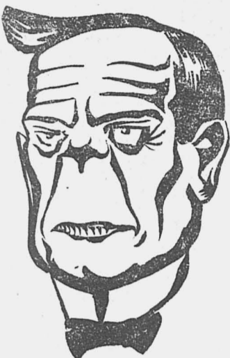
Хикс в неприятном настроении.

Прения в палате общин по поводу налета отсрочены. Разногласия среди консерваторов. Ожидается правительственный кризис.