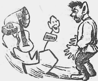
— Товарищ избач, получайте.

В Шаховской избачитальне была граммофон. Избач продал граммофон и купил гитару. Гитару избач продал и купил дров... П выгодней избач променял граммофон на гитару, гитару на дрова, а дрова на пшкы.