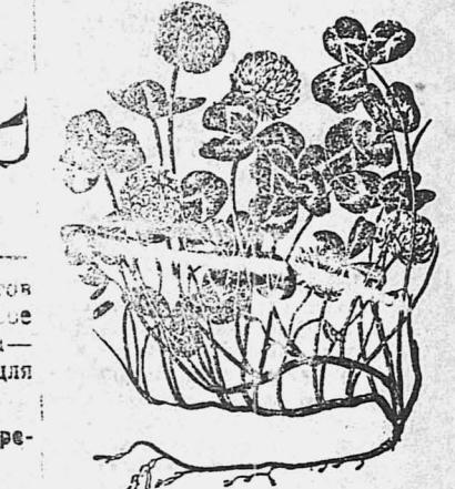
На рисунке: клевер белый ползучий.

Как завести в деревне такой семенной рассадник, какие луговые травы и как сеять можно всегда узнать от участкового агронома или специалиста по луговодству (культуртехника).