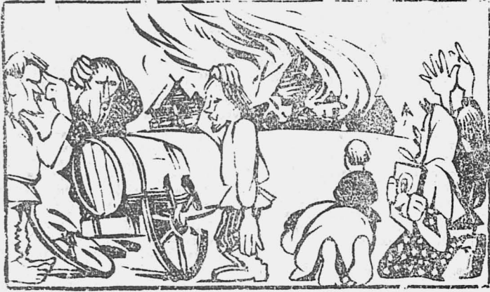
Приблизительно так было во время пожара в Белоярске.

О Белоярском говорили, что благодаря энергии сельсовета, построена пожарная каланча и приобретена пожарная машина.