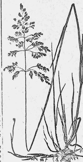
На рисунке: мятлик луговой.

Крестьянам-культурникам на своих полях надо разводить семена кормовых трав. — Разведение семян кормовых трав дает хороший доход.