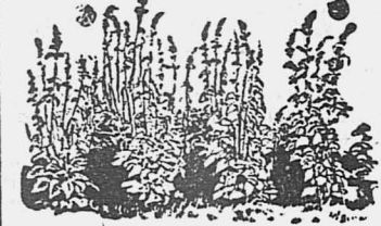
Семенные гряды с кормовой свеклой в цвету.

чатся неудачей: то семян не достанешь, то купленные семена оказываются плохими. Помочь в этом деле может только выведение корнеплодных семян