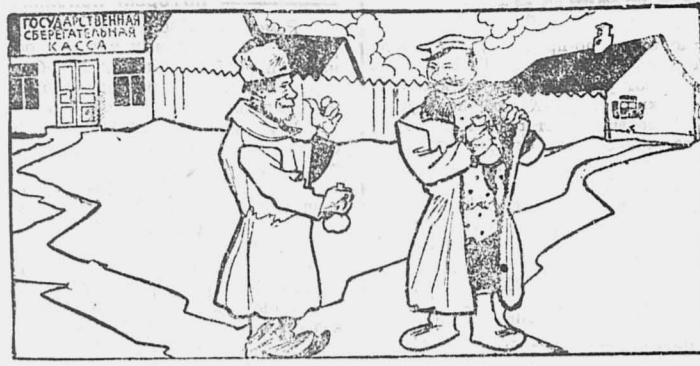
— Не надейся на авось да небось, а займись лучше хорошей постройкой.

Вооружение против огня — огнестойкое строительство, правильная застройка деревни и организация добровольно-пожарных дружин.