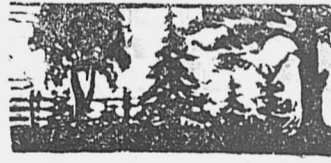
ГДЕ МОГИЛА И ГДЕ НАША СИЛА.

Мудрые слова на которые надо-бы обратить внимание кому следует потому, что от этих мудрых слов осталась Никольская беднота без леса.