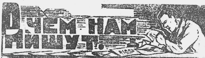
ДЧЕМ НАМ НИШУТ.