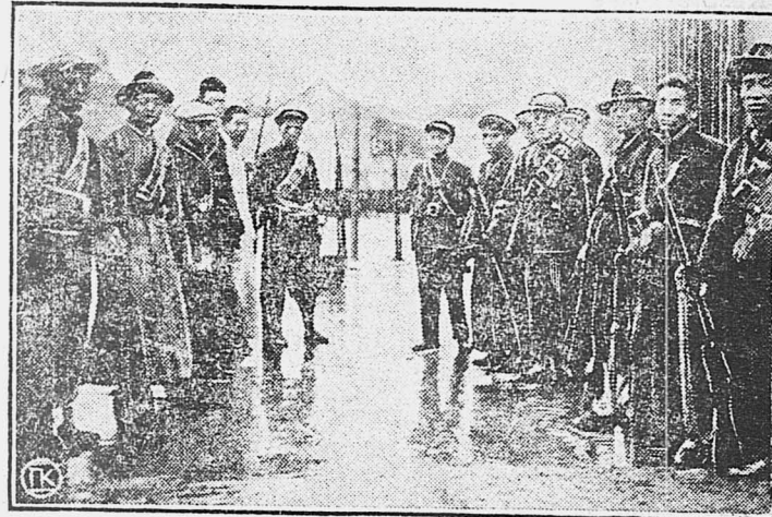
Вооруженные китайские рабочие на улицах Шанхая. (Снимок сделан до предагельского переворота Чан-Кай-Ши, разоружившего дружины).