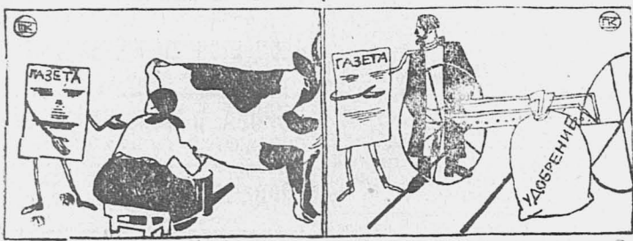
Газета — лучший советчик крестьянина и крестьянки.

Крестьяне охотно вступают в кружки радио-любителей.