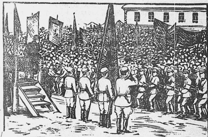
Присяга красноармейцев в г. Барнауле 1 мая.

В отношении снабжения нашей армии техническими средствами борьбы мы продолжаем отставать от современных западно-европейских армий. Однако, мы должны со всей категоричностью заявить, что военная