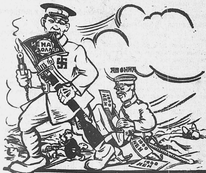
Последняя, славная атака генерала Чан-Кай-Ши.

же сообщает: Чжан-Цзо-Лин ответил отказом на просьбу Чан-Кай-Ши, обеспечить тыл армий, находящихся под командованием Чан-Кай-Ши. Переняв, что Чжан-Цзо-Лин приказал назвать арестованных в ноябре в Тянь-Цзине гоминдановцев, в том числе двух друзей Чан-Кай-Ши.