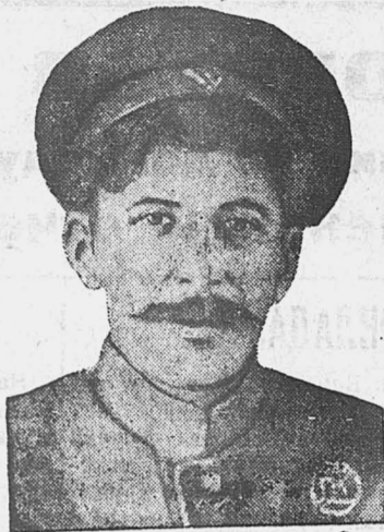
Тов. Сталин в 1917 году.

ЦК ВКП был прав, когда в марте 1927 года, говорил что: первое—«в настоящее время китайская революция, в связи с перегруппировкой классовых сил и концентрацией империалистических армий, переживает критический период; что ее дальнейшие победы возможны лишь при решительном курсе на развитие массового движения», второе—«необходимо держать курс на вооружение рабочих и крестьян и превращение крестьянских комитетов на местах в фактические органы власти и вооруженной самообороны», третье—«компартия не должна сдвигать изменническую, реакционную политику правых гоминдановцев, должна мобилизовать массы вокруг Гоминдана и Китайской компартии на разоблачении правых» (3 марта 1927 года).