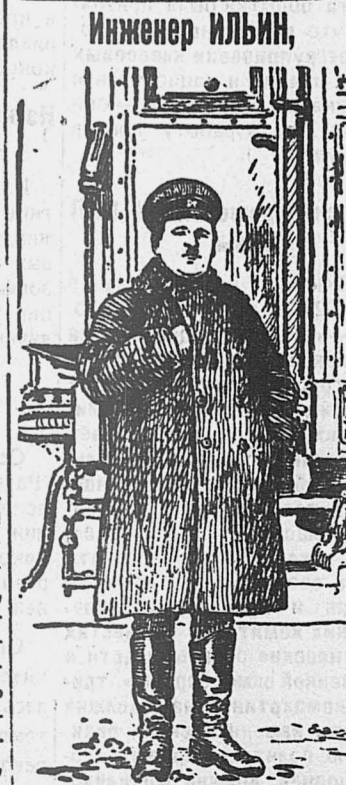
начальник постройки Туркестано-Сибирской железной дороги.

ТЕГЕРАН, 17. 16 апреля, в Реште происходил митинг, посвященный китайским событиям. Митинг прошел под лозунгом поддержки национального революционного движения.