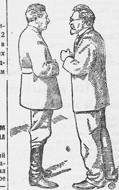
Тов. Калинин беседует с тов. Сталиным.

По сообщениям газет, происходит сосредоточение войск вдоль нижнего течения р. Ян-Цзы Цзяна между Ан-Цином и Нанкином, главным образом, в районе Уху, где ожидается бой.