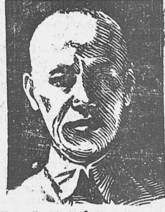
Чанкайши перебежчик и предатель.

Правое крыло Гоминдана образует в Нанкине контр-революционное правительство. Чан-Кай-Ши заигрывает с империалистами и северными генералами.