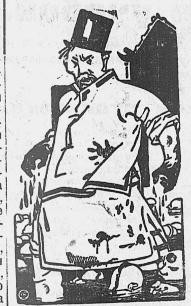
По следам палача китайских трудящихся Чжан-Цзо-Лина.

Впереди процессии шли работницы и дети рабочих. Когда рабочая процессия приблизилась к воротам штаба, солдаты открыли по рабочим оружейный и пулеметный огонь. Число убитых, главным образом, женщин и детей, находившихся в передовых рядах процессии, достигает 40 человек и раненых несколько сот человек. В другой рабочей процессии, подвергшейся расстрелу, убито 50 человек. В районе южного вокзала и трамвайного парка, где собралось около 6 тысяч рабочих убито около 20 человек. Всего убито за вчерашний день около 100 рабочих и ранено около 500. Вчера вечером войска устроили настоящую осаду помещения клуба «Коммерче-Пресс», который был вновь занят рабочими. У здания находятся до 500 человек мужчин, женщин и детей.