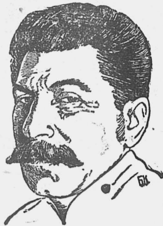
29 марта, на 5-й Всесоюзной конференции ВЛКСМ выступил тов. Сталин.

Вот почему к сибирскому съезду Советов приковано такое исключительное внимание широких слоев рабоче-крестьянских масс.