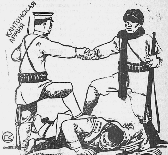
Солдат национальной армии рабочему Шанхая: Жму руку, товарищ. В союзе с тобой — победим всех контр-революционеров.