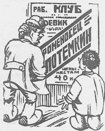
«Эх, зяви-те, сколько ждал «Потемкина» поглядеть, а они сорок копеек завернули».

Алейский поселковый клуб до того пристрастился к наживе, что забыл наблюдать за чистотой и порядком.