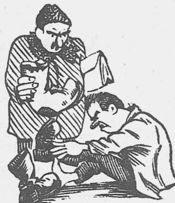
Монтеры ходят по мокро в пимах. КОМСА.

— Мы, говорят,—ждем распоряжения о выдаче сапог.