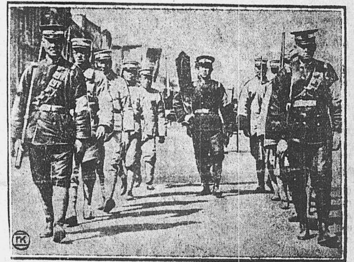
Политика террора и публичных казней, введенная милитаристами в Шанхае с момента приближения национальных (кантонских) войск, не принесла победу реакционеру. На снимке — патруль войск Сун-Чуан-Фана на улицах Шанхая. В середине солдат несет меч — орудие расправы без суда над заведомыми в сочувствии Кантону.