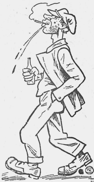
Таким не место в правлении кооператива.

Дрова закуплены во время, а это самое главное в работе маслодельного завода. Правлением артели наняты сборщики молока на выгодных условиях. В прошлом году сборщикам платили по 7 копеек с