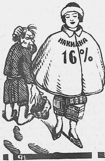
— Эта барыня задавила кооператив... Пора бы ее убрать.

В некоторых кооперативах накидки на товары достигают 16 проц. (Из писем селькоров)