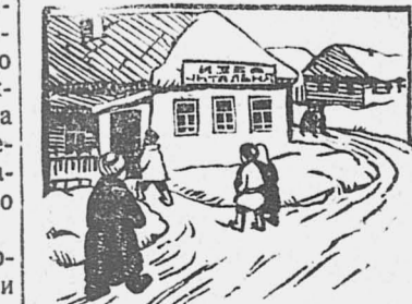
рых начали работу 12 ликпунктов.

Всего в районе назначено 18 сетевых ликпунктов, из кото-