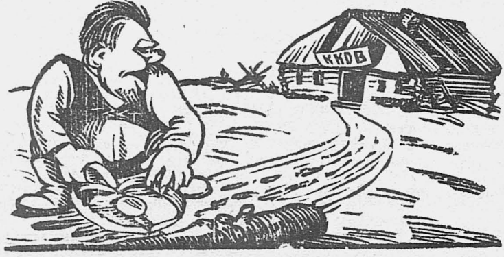
Кулак:—Поставлю капканчик, ан, глядишь, и попадетс... Ведь комитет-то перекосило-перекривило, а мне это на руку.

Там, где общества крестьянской взаимопомощи плохо работают, кулаки расставляют свои капканы и ловят бедноту. (Из селькор. письма)