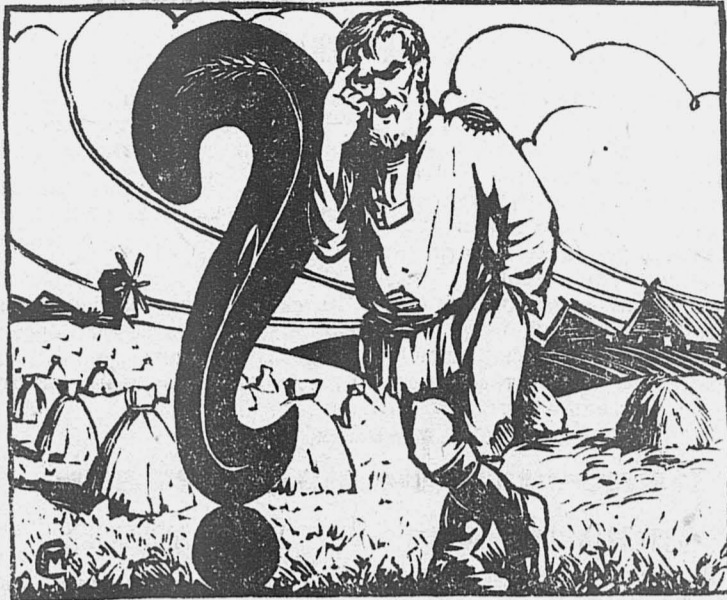
О чем думает этот человек? — Он думает о том, как улучшить свое хозяйство.

Итак, выходит, что с помощью вышеуказанных мер (щиты из хвороста, снежные кучи, кулисный пар, вспашка снега) крестьянин может получить с десятины на 20 пудов больше или, иначе, может успешно бороться с засухой и побеждать ее. Агроном Воронцов.