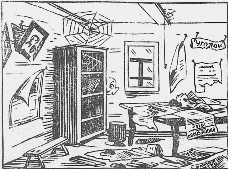
Эта картинка посвящается тем избам-читальням, которые плохо работают.