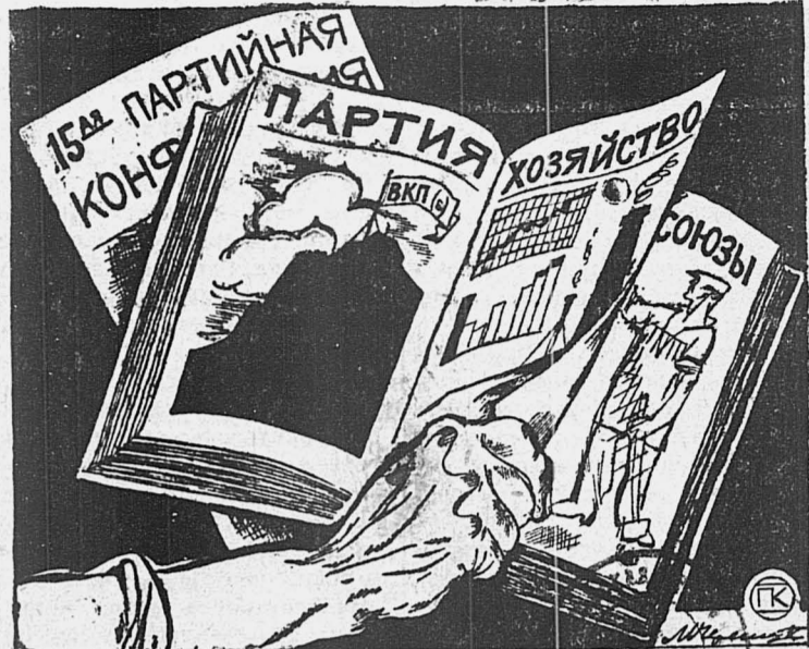
Изучайте решения пятнадцатой партконференции!

МОСКВА, 16. Состоялось объединенное заседание президиумов Авиахима СССР и общества содействия по обороне СССР. Постановлено слить оба общества. Также принято решение созвать в первой половине января 1927 г. Всесоюзный съезд Авиахима. На местах слияние будет произведено только после Всесоюзного съезда Авиахима.