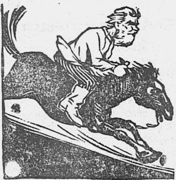
Куда-же он так спешит?

Заметно, улучшилась также и работа сельсоветов. Местный.