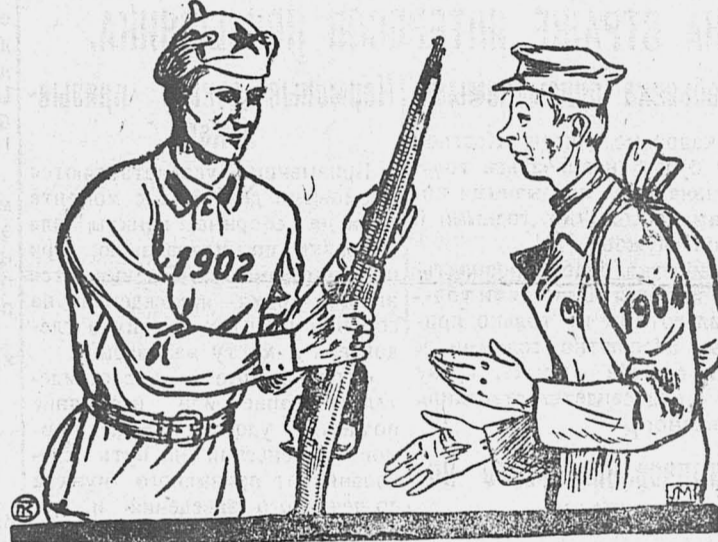
1902—из Красной армии—домой.