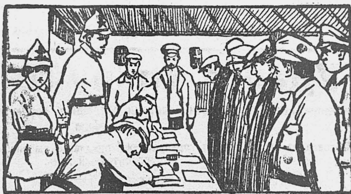
На призывном пункте.

Количество нефти (45.000 т.п), поступающей Нефтьскладу, признано также недостаточным для обеспечения годовой потребности округа в этой продукции.