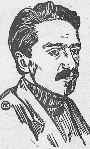
Заявление Наркомторга СССР т. Микоян.

МОСКВА, 24. В беседе с сотрудником ТАСС Наркомторг СССР Микоян заявил, что уси-