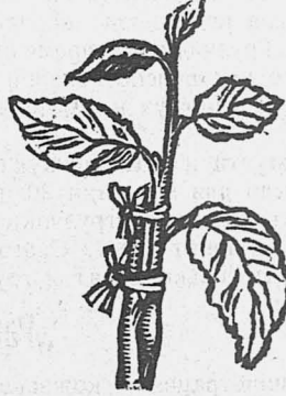
Яблоня после прививки.

Почва, на которой растут деревья, сильно плотная и в недостаточной мере питает деревья.