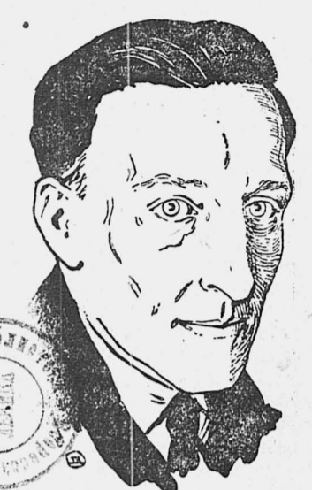
(К пятилетию со дня смерти, исполнившемуся 7 августа 1926 г.).