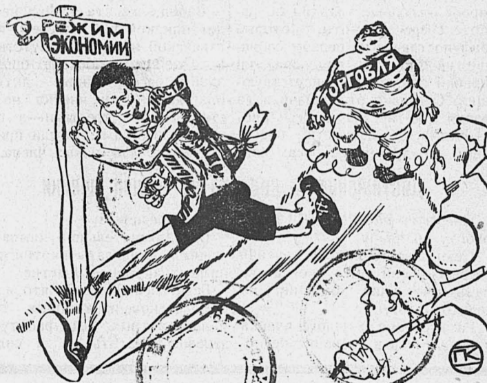
Голос из публики: — Подхлестнуть бы его, заднего...

Приходится подчеркнуть, что в аппарате госторговли режим экономии до сих пор еще проводится значительно более замедленным темпом, чем в аппарате госпромышленности. («Правда»)