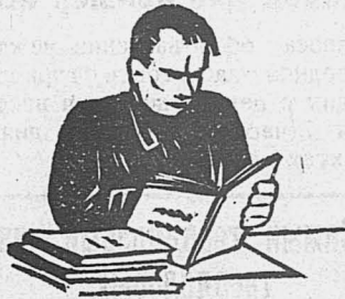
Вот, видите-ли, сидел человек за книгой и вид у него был приличный. Хорошо...