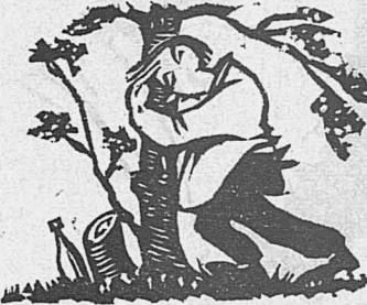
Надоели книги... Пошел папаша в садик, а в садике... ну, видите, что около пня-то стоит... И стоял он, как пень...