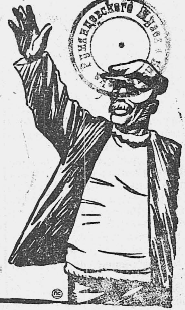
Голос английского горняка.