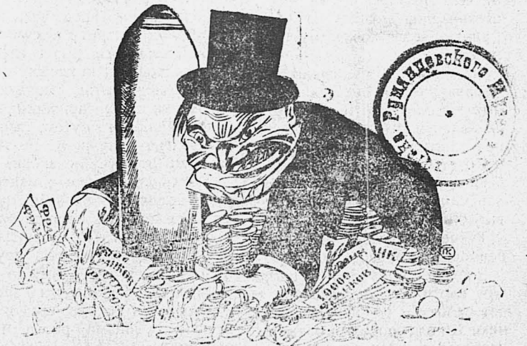
Капиталист.—Время для мира еще не пришло!