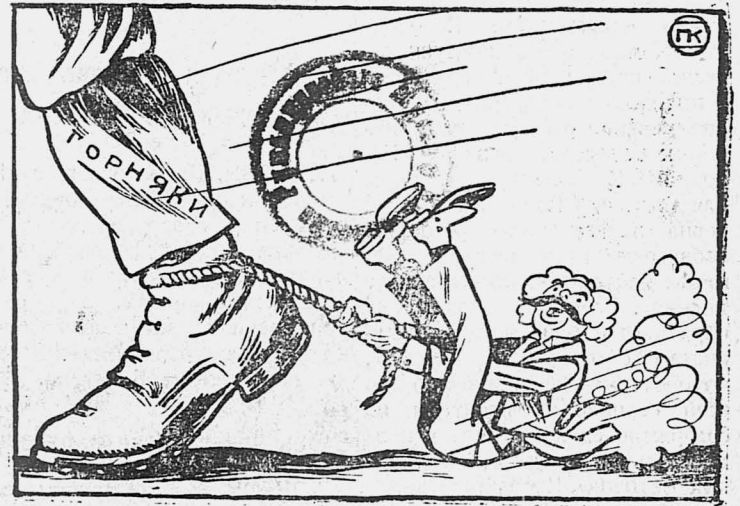
— Ехать так ехать! — сказал Макдональд.