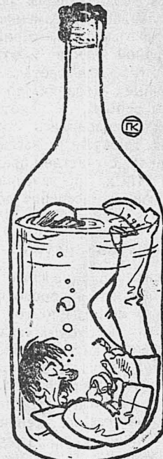
«Во субботу — день ненастный»...

Можно бы еще привести ряд фактов из жизни стенгазет, но жаль, что места мало в газете. В заключение выразим пожелание, чтобы райкомы и ячейки внимательнее читали руководящие статьи и обзоры стенгазет с. Тальменки. М. Чумышанин.