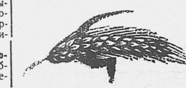
Иллюстрация к статье о благодарности курсантов.