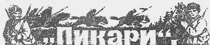
(Из истории партизанского движения на Алтае).