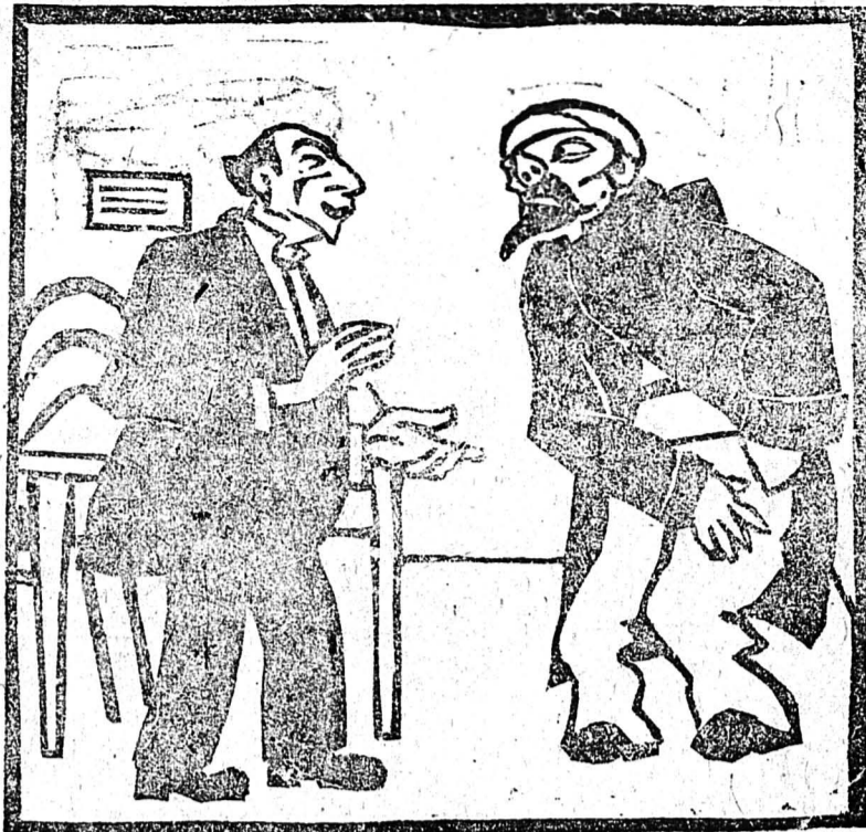
Взяточник: (Напману) Для успешности дела нужно «смазать»... Напман: Гм... По-ни-ма-ю... с нашим удовольствием...

Первым на митинге выступает, случайно пошедший к нам на торжество, уполномоченный Губпрофкома.