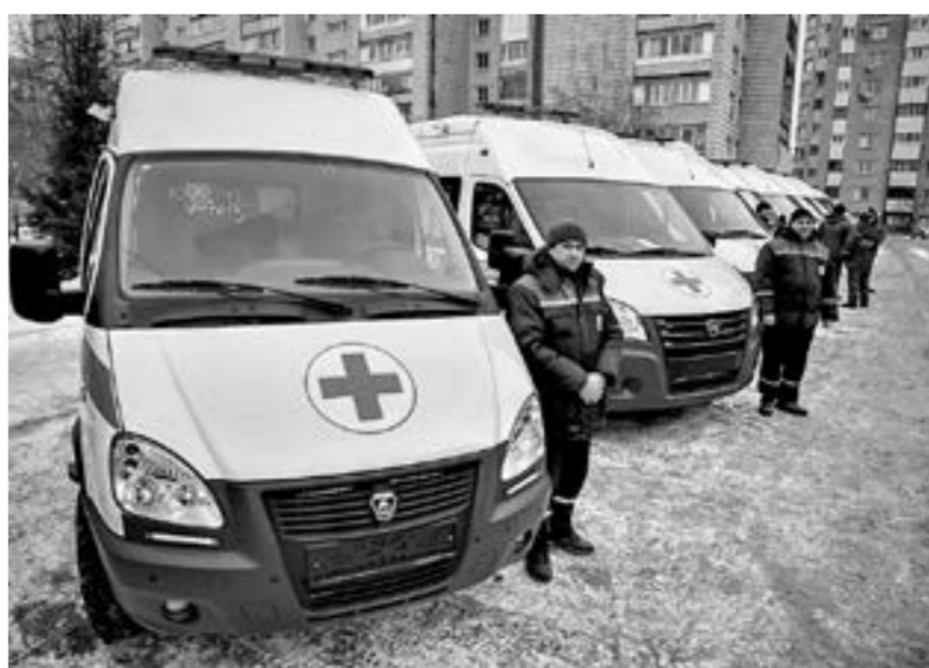
22 новые машины приобрели для медучреждений края.