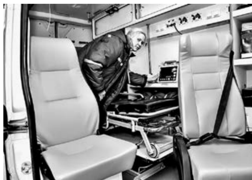
В реанимобиле есть все необходимое.