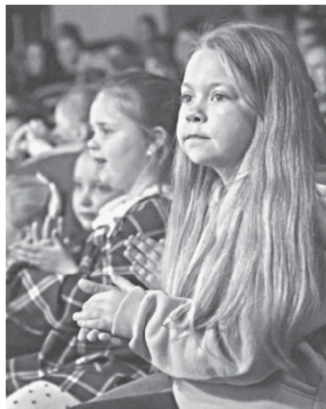
Для самых важных зрителей!