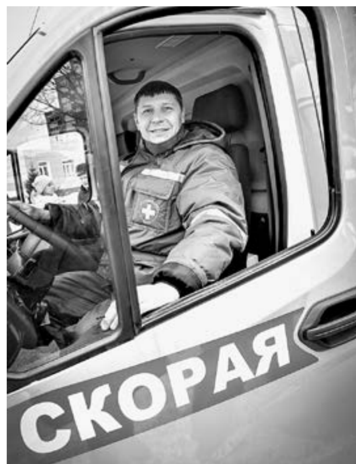
Медики уже оценили обновку.

Для этого системно обновляют автопарк, оснащают автомобили медоборудованием за счет средств как федерального, так и краевого бюджета. – В преддверии Нового года за счет средств краевого бюджета приобрели 15 машин скорой помощи, в том числе один реанимобиль. Мы продолжаем развивать доступность медицинской помощи на селе, – сказал руководитель ведомства. – Серьезно и системно подходим к оказанию палли-