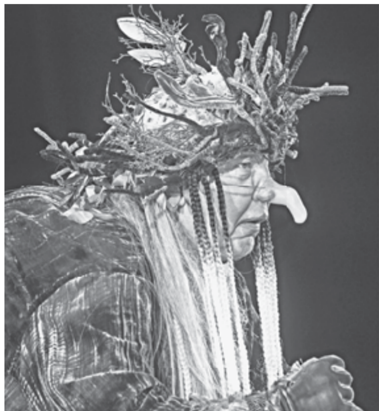
Заслуженный артист Эдуард Тимошенко в роли Бабы-яги.