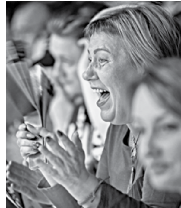
Болеельщики знали команду вперед.

Вся команда демонстрирует уверенную игру в обороне, которая вызывает одобрение болельщиков. В атаке дела обстоят немного хуже: по набранному очкам в 15 матчах (1115) барнаульцы занимают 10-ю строчку. По реализации двухочковых в среднем за игру (48,1%) – 13-е место, по реализации трехочковых (31,6%) – девятое. Все это и не позволяло обыгрывать клубы из верхней части таблицы, которые демонстрируют более результативную игру.