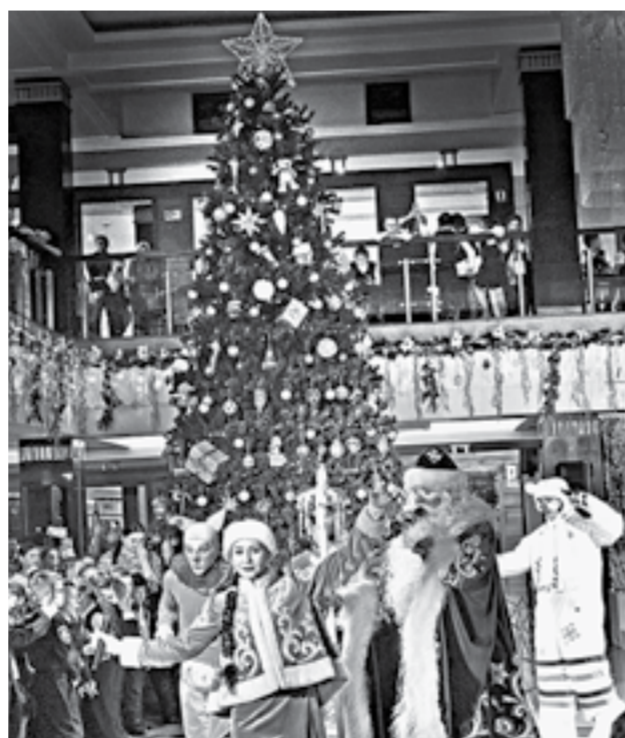
Интермедия в театральном фойе.

Режиссер рассказывал, что «Морозко» был любимой сказкой его мамы и ему захотелось соприкоснуться с этой семейной историей