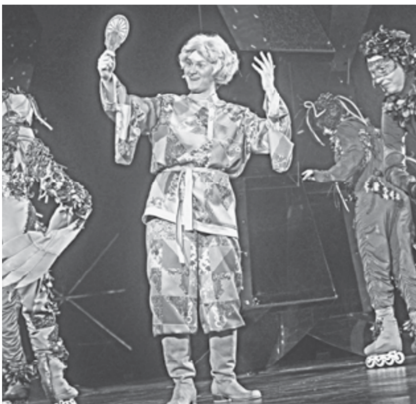
Спектакль удивляет и оформлением, и сюжетом.