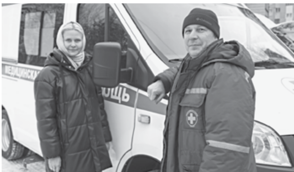
Общая стоимость машин составила около 90 млн рублей.

– Приятно подводить итоги года таким образом. Нельзя сказать, что это подарок. Это совершенно заслуженная передача техники для самого важного